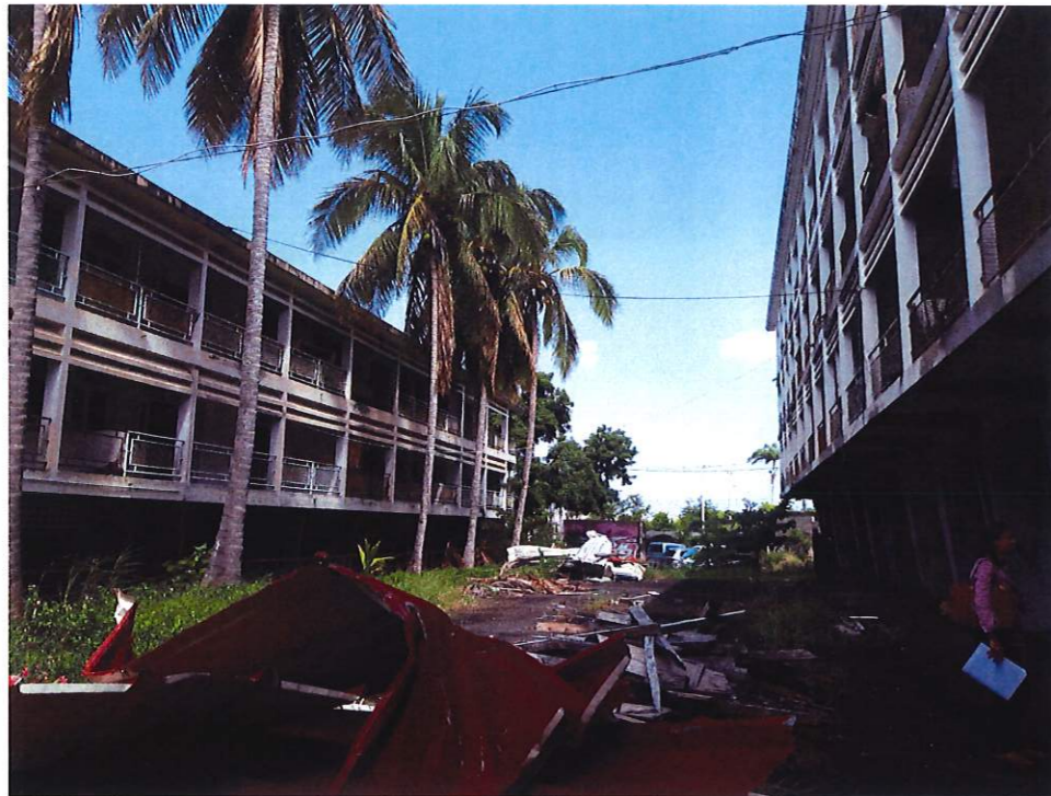
POINT DE VUE 2