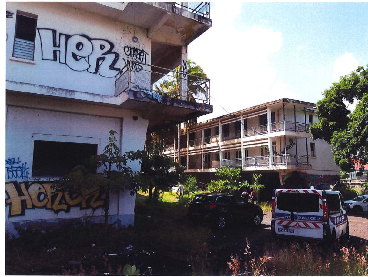
POINT DE VUE 1