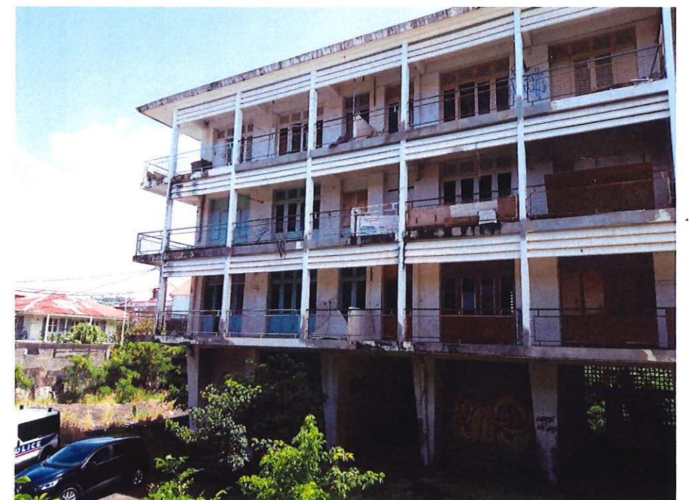
POINT DE VUE 4