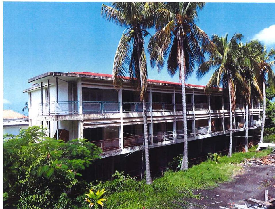
POINT DE VUE 3